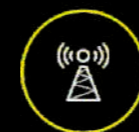
Antena de red móvil